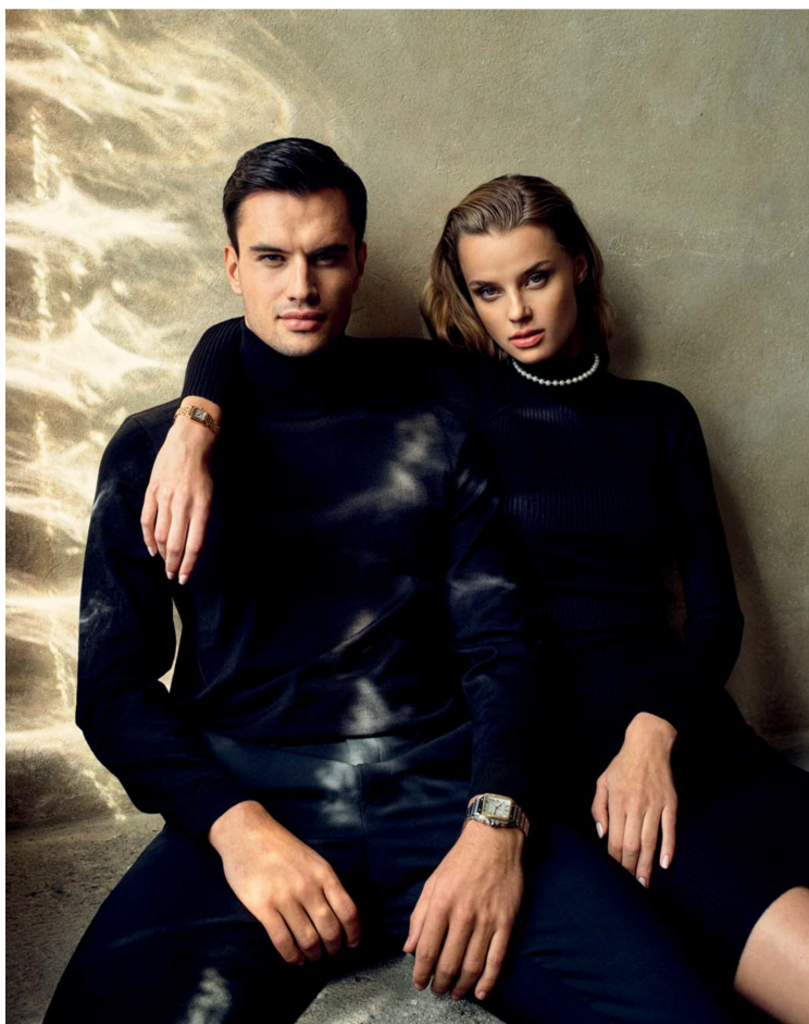
CARTIER PANTHÈRE DE CARTIER pouzdra a tah růžové zlato, 23 × 30 mm, modrý safír ve tvaru kabošonu, quartzový strojek, 555 000 Kč, prodává butik Carallinum